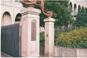
中京大学附属中京高校 南門

中京大学附属中京高等学校・中京大学の風景や生徒・学生の姿など、梅村学園のいまを生徒・学生世代の視点からお届けしています。ぜひご覧ください。