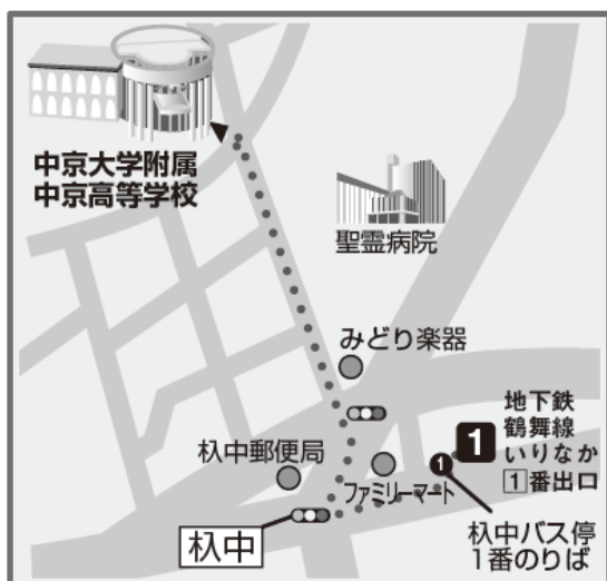
高校会場：中京大学附属中京高等学校